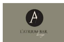
L'Atrium, Bar Lounge