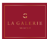
La Galerie, Brasserie de tradition

Une camomille à la liqueur souple, soulignée d'accents frais et aériens de fleurs blanches de magnolia, d'une persistance - aromatique.