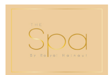
The Spa by Royal Hainaut

Prix net en euros, l'abus d'alcool est dangereux pour la santé. A consommer avec modération.